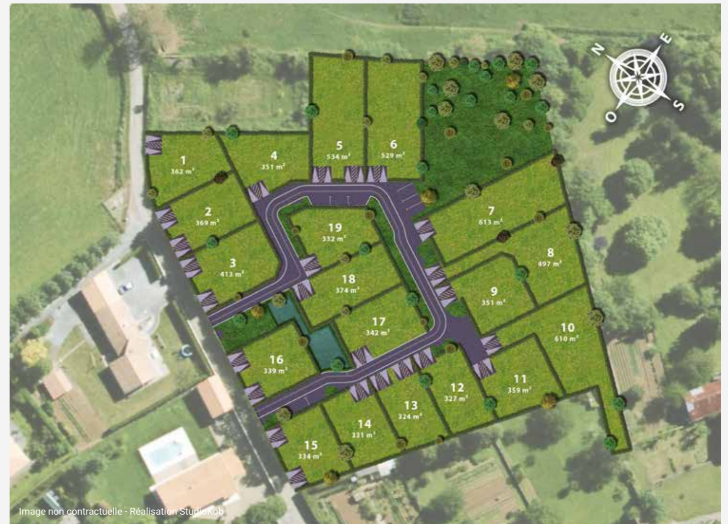
Image non contractuelle