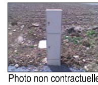
Coffret électricité (projet)