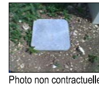
Boîte de branchement télécom (projet)