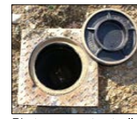
Tabouret de branchement eaux usées (projet)