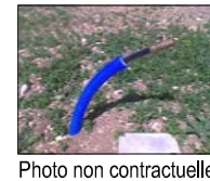
Sortie pour compteur eau potable (projet)