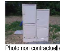
Coffret électricité et gaz (projet)